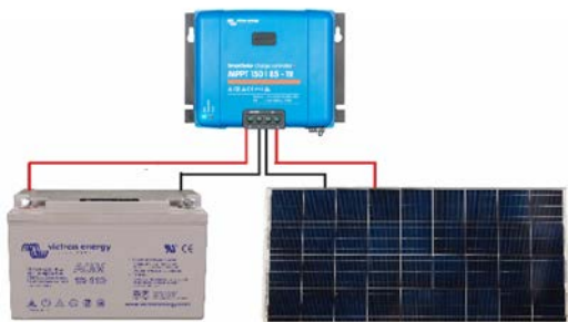
Рисунок 1: Силовые подключения Illustration 1 : Connexions électriques Abbildung 1: Stromanschlüsse Figura 1: Conexiones de alimentación Bild 1: Strömanslutningar