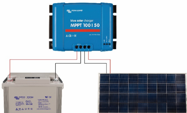
Рисунок 1: Силовые подключения