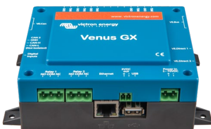
Venus GX, передний угол