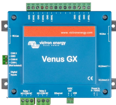
Venus GX с соединителями