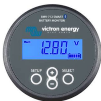
Bluetooth считывание BMV-712 Smart Battery Monitor