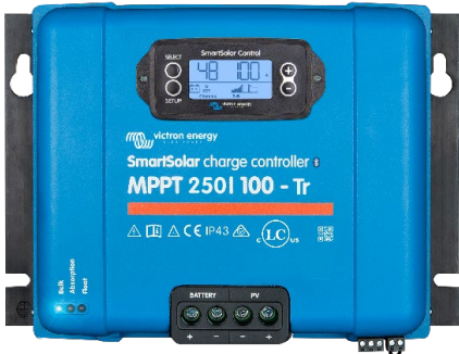
Контроллер заряда SmartSolar MPPT 250/100-Tr с опциональным подключаемым экраном