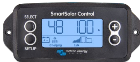
SmartSolar pluggable display

Просто снимите резиновую заглушку, которая закрывает разъем спереди контроллера и вставьте кабель монитора.