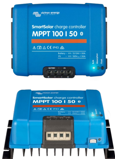
Контроллер заряда SmartSolar MPPT 100/50

- Смартфоны на Apple и Android, планшеты и другие устройства. - Color Control GX и другие устройства GX.