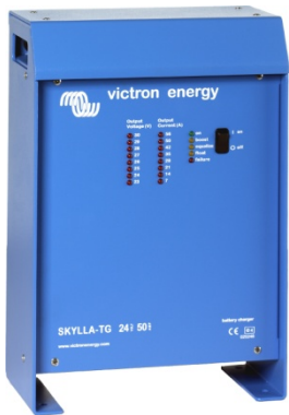
Зарядное устройство Skylla 24 В 50 А